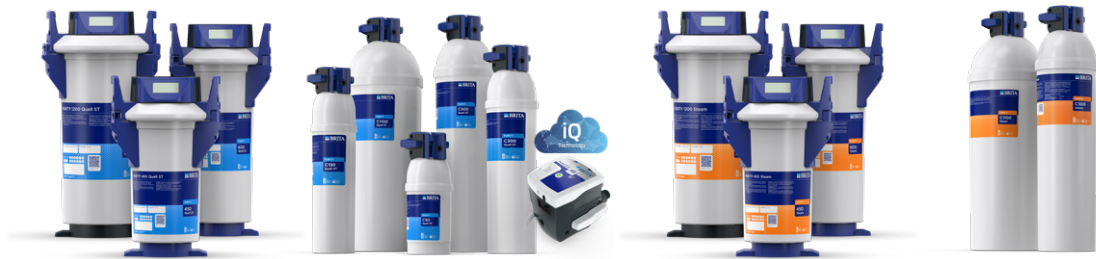
PURITY Quell ST PURITY C Quell ST / PURITY C iQ PURITY Steam PURITY C Steam

Hier sehen Sie das gesamte PURITY Filterportfolio speziell für leistungsstarkes Catering und Großküchen auf einen Blick. Unabhängig von den lokalen Wassergegebenheiten bietet BRITA Professional mit PURITY für nahezu alle Situationen die passende Produktlösung, die auch für Ihre Anwendung das optimale Wasser bereitstellt.